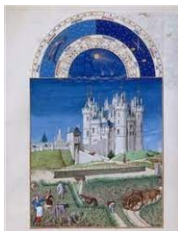
Les très riches heures du Duc de Berry (1485). Le bleu de l'illustration est obtenu grâce à la pierre de lapis-lazuli.