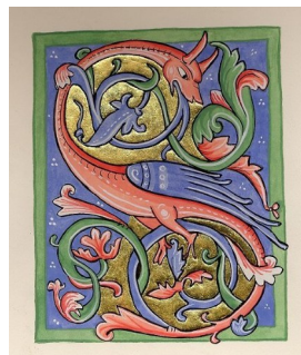
Une lettrine construite