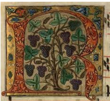
Une lettrine ornée