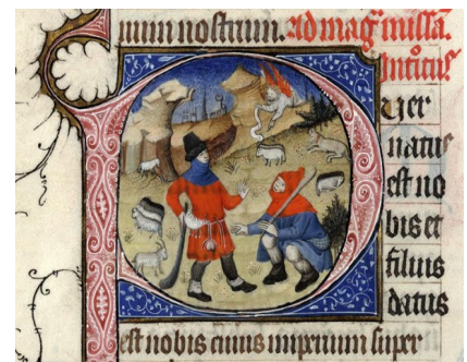
Une lettrine historiée